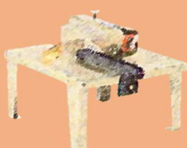
丸のこベンチスタンド