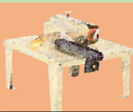
丸のこベンチスタンド