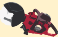
エンジンカッター