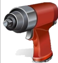
インパクト レンチ