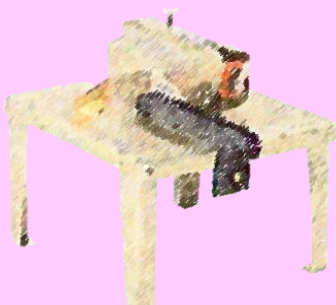
丸のこベンチスタンド