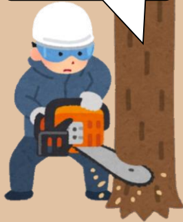
チェーンソーを使った立木の伐木