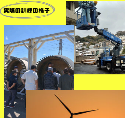
実際の訓練の様子

〒805-0048 北九州市八幡東区大蔵二丁目13-7 TEL：093-651-3775 FAX：093-651-5573