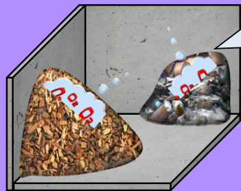
第一種酸素欠乏危険場所

修了者は第1種及び第2種酸素欠乏危険場所で作業主任者に就くことができます。 定員：40名